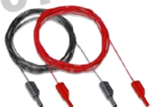
S2012 10米红、黑连续性测试线