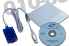
A1171 USB-RS232 转换器