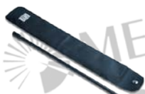
A1201 连续性测量绝缘杆